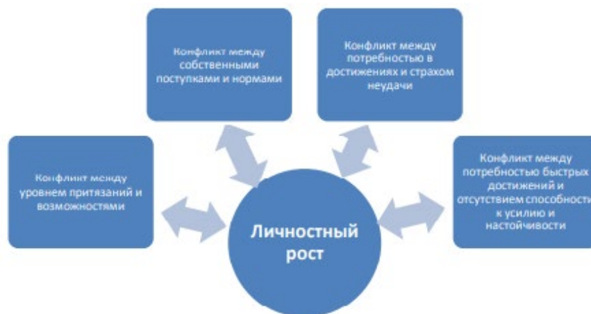
Рисунок 1 – Взаимосвязи между компонентом психологического благополучия «Личностный рост» и типами внутриличностных конфликтов

Иллюстрации могут иметь наименование и пояснительные данные (подрисуночный текст). Наименование помещают под иллюстрацией и пояснительными данными (выравнивают по левому краю, сохраняя отступ абзаца, между наименованием рисунка и основным текстом делается интервал на ширину строки) и формулируют, например, следующим образом: