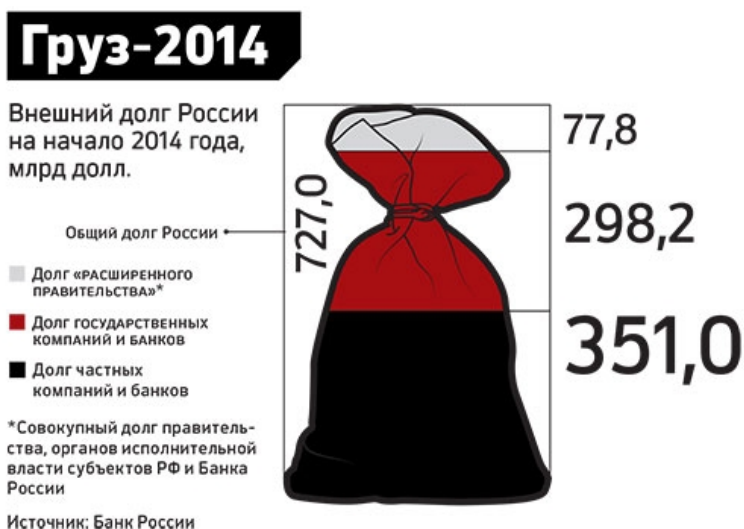
Рис. 3. Структура внешнего долга Российской Федерации (по состоянию на 2014 год)

экономического развития России связывают с гигантской задолженностью российских корпораций и банков. Если началу 2008 г. она составляла 413 млрд. долл. США, то в 2012 – 2014 гг. превышала 600 млрд. долл. США, а на 1 октября 2015 года составила 494 млрд. долл. Более наглядное представление о ситуации даёт следующий рисунок: