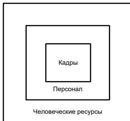
Рис. 1. Соотношение базовых (исходных) категорий HR-менеджмента

2. Каковы основные причины игнорирования персональных интересов работников в Российской Федерации? Ведь не секрет, что руководителей, для которых «незаменимых работников не бывает», гораздо больше, чем «персоналистов», стремящихся видеть в каждом работнике Личность.