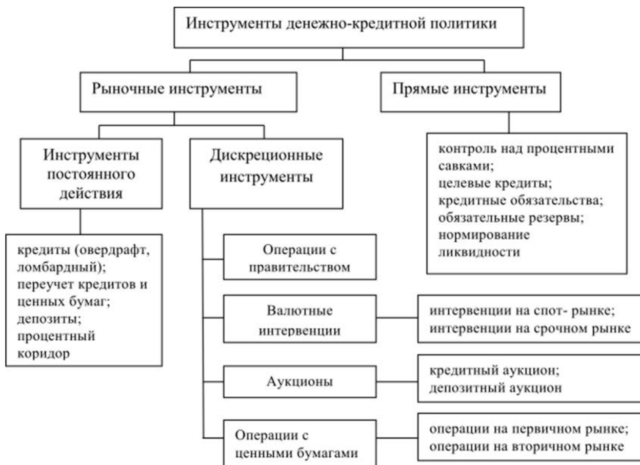
Рис. 1. Инструменты денежно-кредитной политики 1

В конце наименования иллюстрации точку не ставят, но обязательно указывают источник, если иллюстрация заимствована, не принадлежит автору курсовой работы.