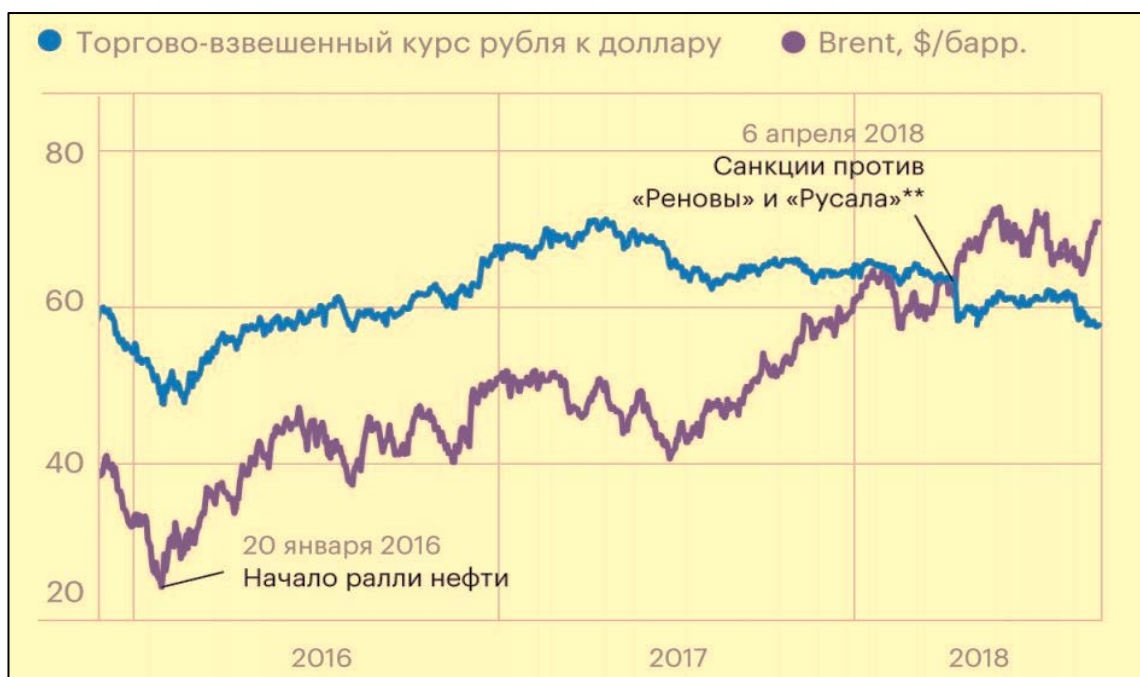
Рисунок 2 - Динамика курса рубля и цен на нефть марки Brent, 2016-2018 (Источники: Bloomberg; РБК 1 )

Таблицы применяют для характеристики точных данных, лучшей наглядности и удобства сравнения показателей, а также сопоставимости информации, полученной из разных источников.