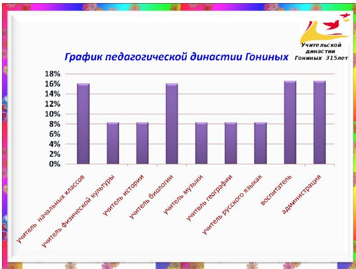
Рис. 2 – График педагогической династии Гониных

случаях, когда их немного и они кратки. Многословные надписи заменяют цифрами, расшифровка которых приводится в пояснительных данных. На одном графике не следует приводить больше трёх кривых.