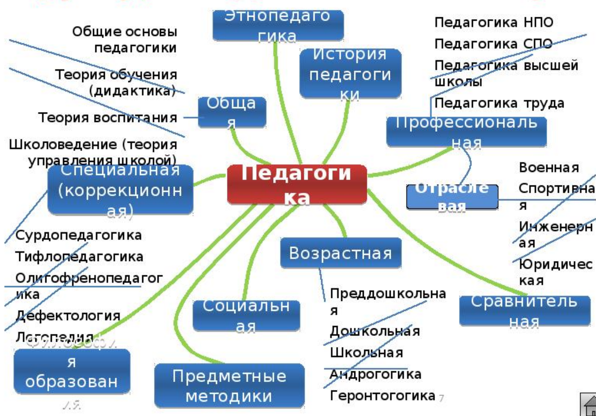
Рис. 1 – Структура педагогической науки

В конце наименования иллюстрации точку не ставят, но обязательно указывают источник, если иллюстрация заимствована, не принадлежит автору курсовой работы. Иллюстрации следует располагать по тексту ближе к первому упоминанию. Значительные по размеру и объему данные иллюстрации лучше выносить в приложения к работе. На весь иллюстрационный материал должны быть ссылки в тексте; например: «... как это представлено на рис. 2».