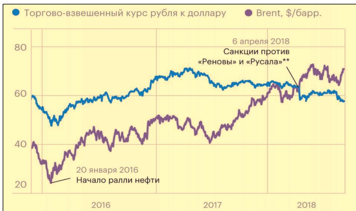
Рисунок 2 - Динамика курса рубля и цен на нефть марки Brent, 2016-2018 (Источники: Bloomberg; РБК 1 )

Таблицы применяют для характеристики точных данных, лучшей наглядности и удобства сравнения показателей, а также сопоставимости информации, полученной из разных источников.