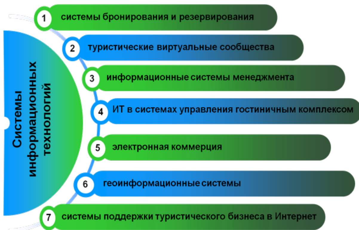
Рисунок 1 – Системы информационных технологий

Иллюстрации могут иметь наименование и пояснительные данные (подрисуночный текст). Наименование помещают под иллюстрацией и пояснительными данными (выравнивают по левому краю, сохраняя отступ абзаца, между наименованием рисунка и основным текстом делается интервал на ширину строки) и формулируют, например, следующим образом: