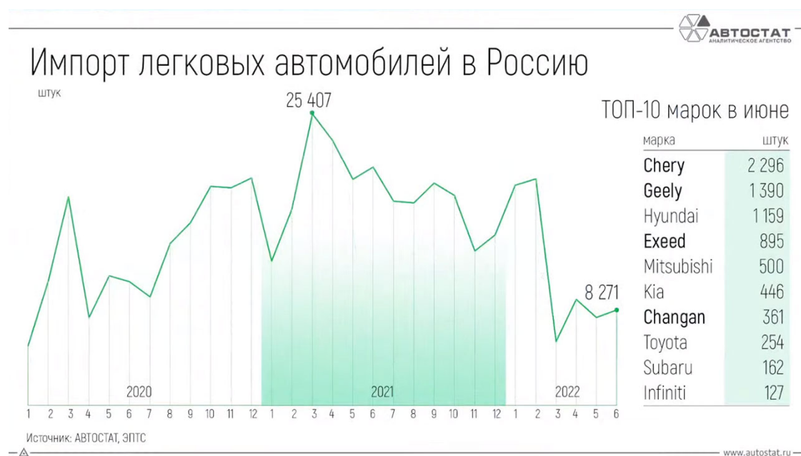
Рис. 2 – Импорт легковых автомобилей в Россию

В качестве иллюстративного материала в работах часто используются графики. График целесообразно использовать для характеристики и прогнозирования динамики непрерывно меняющегося показателя при наличии функциональной связи между фактором и показателем. Оси абсцисс и ординат должны иметь условные обозначения и размерность применяемых величин. Надписи, относящиеся к кривым и точкам, производят только в тех случаях, когда их немного и они кратки. Многословные надписи заменяют цифрами, расшифровка которых приводится в пояснительных данных. На одном графике не следует приводить больше трёх кривых.