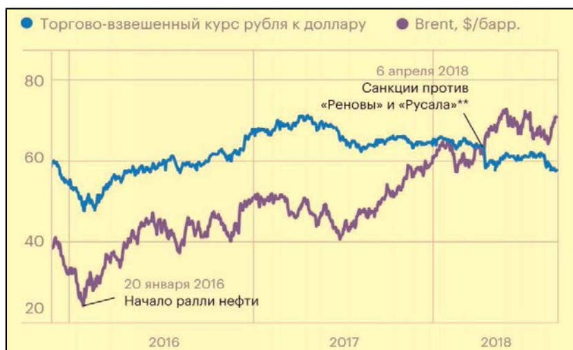
Рисунок 2 – Динамика курса рубля и цен на нефть марки Brent (2016–2018) 2

В качестве иллюстративного материала в работах часто используются графики. График целесообразно использовать для характеристики и прогнозирования динамики непрерывно меняющегося показателя при наличии функциональной связи между фактором и показателем. Оси абсцисс и ординат должны иметь условные обозначения и размерность применяемых величин. Надписи, относящиеся к кривым и точкам, производят только в тех случаях, когда их немного и они кратки. Многословные надписи заменяют цифрами, расшифровка которых приводится в пояснительных данных. На одном графике не следует приводить больше трёх кривых.