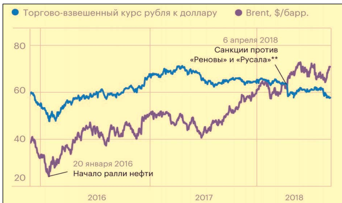
Рисунок 2 - Динамика курса рубля и цен на нефть марки Brent, 2016-2018 (Источники: Bloomberg; РБК 1 )

Таблицы применяют для характеристики точных данных, лучшей наглядности и удобства сравнения показателей, а также сопоставимости информации, полученной из разных источников.