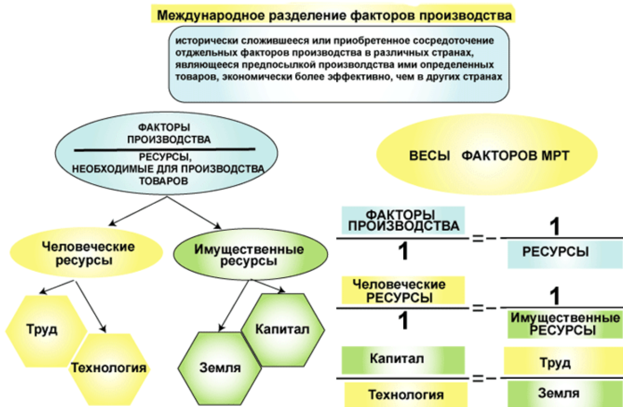
Рисунок 1 – Сущность международного разделения труда и факторы, его определяющие

пояснительными данными (выравнивают по левому краю, сохраняя отступ абзаца) и формулируют, например, следующим образом: